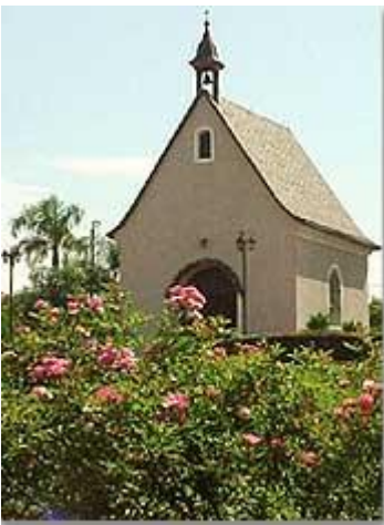
Santuario de Schönstatt, Paraguay, Ciudad del Este

Nosotros somos las piedras vivas y el santuario de Dios.