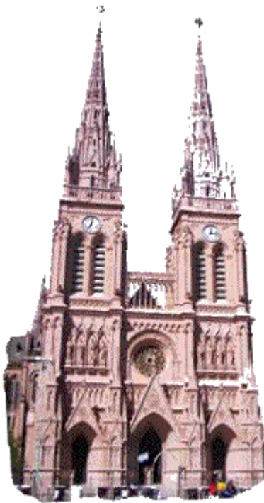
Luján Santuario y Basílica Nacional (Argentina)