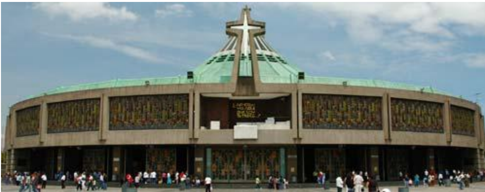
Guadalupe, México, Basílica y Santuario Internacional