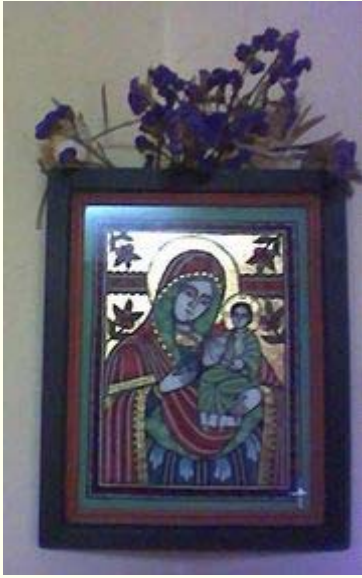
Icono en vidrio (transilvania)